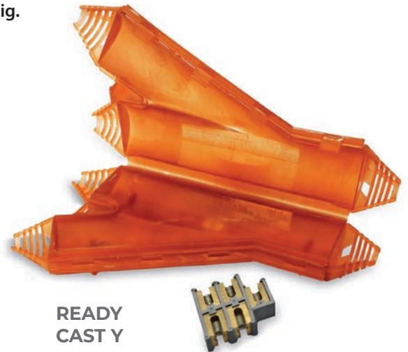
READY CAST Y