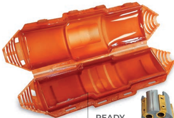
READY CAST L