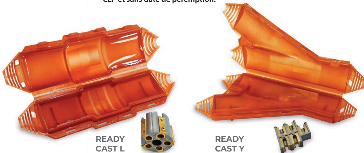
READY CAST L