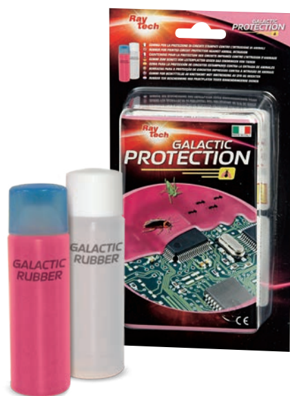
Composizione del kit: 2 flaconi di prodotto bicomponente

Kit per la connessione, manutenzione e protezione degli impianti elettrici.