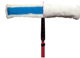
Shiny Brush SB4

Per la corretta applicazione del prodotto anche in zone difficili da raggiungere "a braccio" è disponibile la spazzola in microfibra, montata su braccio telescopico che aggetta fino a 4 m.