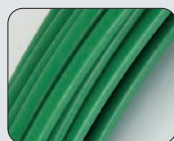
Speedy Steel Sonda in nylon-acciaio Ø 6 mm