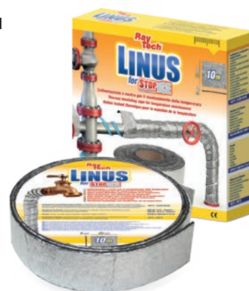
50 mm 3 mm